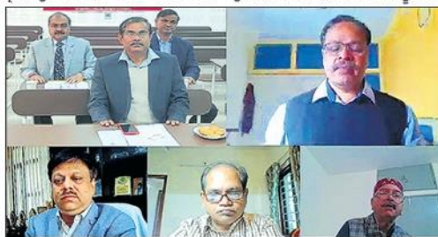
● ਸਲਾਈਟ ਲੋਗੋਵਾਲ ਵਲੋਂ ਕਰਵਾਏ ਆਨ-ਲਾਈਨ ਸ਼ਾਰਟ ਟਰਮ ਕੋਰਸ ਦੇ ਉਦਘਾਟਨੀ ਸਮਾਗਮ ਦੀ ਝਲਕ।